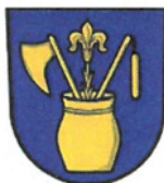
obec Horní Tošanovice